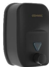
GW04 21 04 03 Inox 304 Negro mate