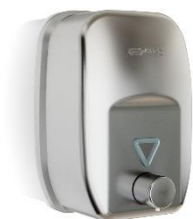
GW04 21 04 01 Inox 304 Satinado