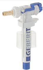
Imagen de ejemplo