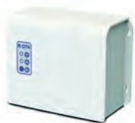
Cuadro de control estándar