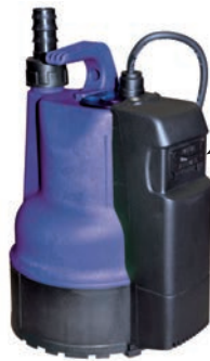
LAGO 500 GI

Regulador magnético con interruptor de Regulación (Manual o Automático)