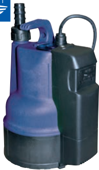
LAGO 300 GI-LS