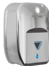
GW04 20 04 02 Inox 304 Brillante