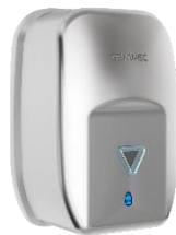
GW04 20 04 01 Inox 304 Satinado