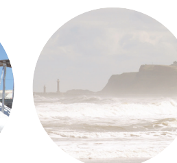
Frange côtière sous embruns