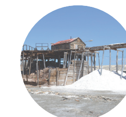
Processus très agressifs chlorurés