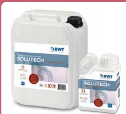
BWT SoluTECH INTEGRAL