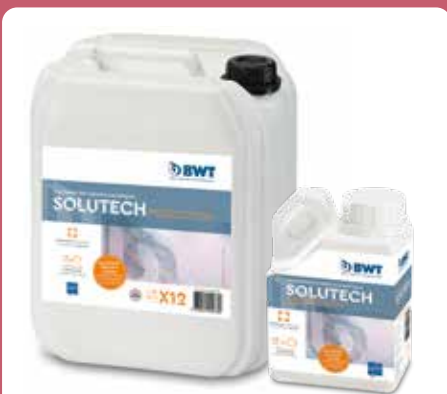
BWT SoluTECH PROTECCIÓN