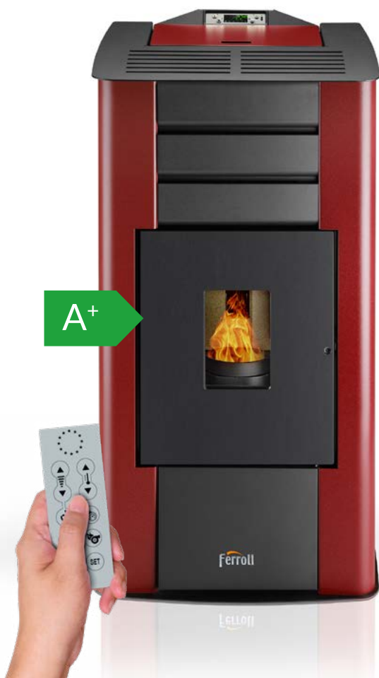
Mando a distancia incluido

Termoestufa de pellets modulante en hierro fundido y acero de 12,7 kW